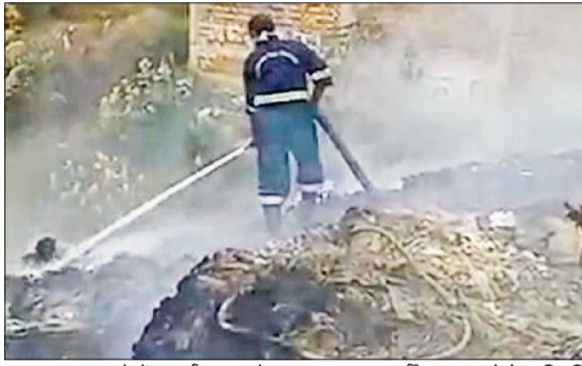
बहादुरगढ़। कचरे में सुसगी आग को बुझाता दमकल कर्मी।