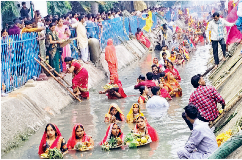
बहादुरगढ़। छठ पर्व पर जल में खड़े होकर भगवान सूर्य की आराधना करती महिलाएं। - खबर पेज 12 पर