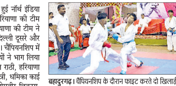
बहादुरगढ़। चैंपियनशिप के दौरान फाइट करते दो खिलाड़ी।