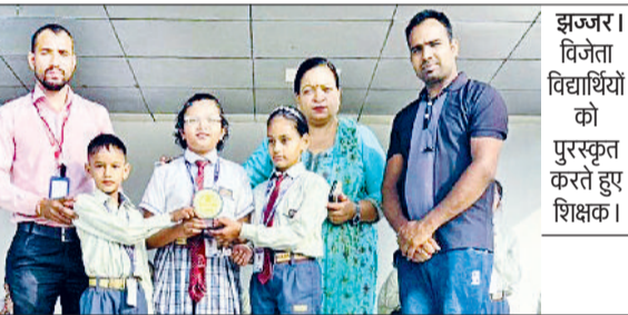
हरिभूमि न्यूज | झज्जर