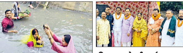
विधायक ने की सूर्य उपासना