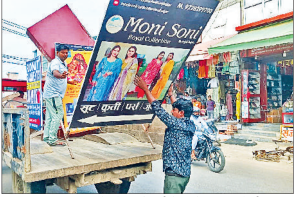
झज्जर। सड़क पर बाहर रखे प्लेक्स को ट्राली में डालते हुए गप कर्मचारी।