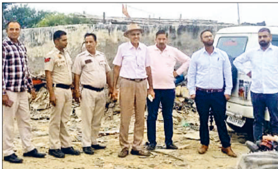
बहादुरगढ़। छोटूराम नगर में दौरा करने पहुंचे अधिकारी।

दरअसल, यहां दो एकड़ जमीन से मिट्टी उठाई गई है। इस कारण बड़ा गड्ढा बना हुआ है, जिसमें औद्योगिक इकाइयों का कचरा डाला जा रहा है। जानकारी में आया है कि कचरे को आग के हवाले कर दिया जाता है। इस वजह से बीते कई दिनों से यहां धुआं उठ रहा है। इस वजह से जहां पर्यावरण प्रदूषण हो रहा है वहीं, आसपास के लोग भी परेशान हैं। मामला संज्ञान में आने के बाद