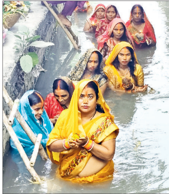
बहादुरगढ़। सोमवार शाम को अस्ताचलगामी सूर्य की स्तुति करती महिलाएं।

सोमवार सायं 5 बजे सूर्य को पहला अर्घ्य दिया गया। जबकि मंगलवार सुबह 6 बजे अर्घ्य देकर छठ पूजन संपन्न होगा। क्षेत्र में यह पूजा जलघर के निकट नहर किनारे, छोटराम नगर, दुर्गा कॉलोनी, सैनिक नगर व लाइनपार क्षेत्र में पूर्वांचलवासियों द्वारा की गई। बता दें कि दो दिन के उपवास के बाद पूर्वांचल से यहां आकर बसे परिवारों की महिलाओं ने डूबते सूर्य की पूजा अर्चना की और समाज में शांति और सुख की दुआएं की। दिनभर जहां पूजा अर्चना की तैयारी चलती रही वहीं तो शाम होते ही लोगों का रुख पूजा अर्चना की सामग्री और फलाहार के साथ जलाशयों की तरफ हो गया।