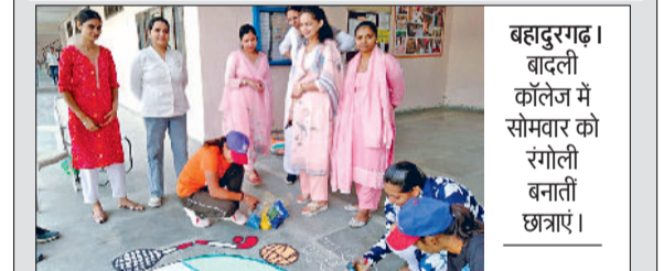
बहादुरगढ़। बादली कॉलेज में सोमवार को रंगोली बनाती छात्राएं।