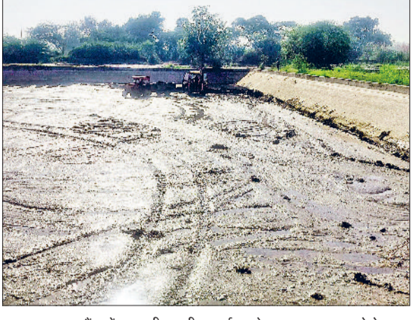
झज्जर। वाटर टैंक में जमा कीचड़ की सफाई करते समय का फाइल फोटो।

कभी बेहतर पेयजल सुविधा वाले गांवों में गिना जाने वाला माजरा गांव आजकल पेयजल संकट से जूझ रहा है। वर्ष 1968 में शहीद मेजर महेंद्र सिंह के नाम पर शुरू हुई यहाँ की पेयजल व्यवस्था अब लगभग ठप हो चुकी है। विभागीय लापरवाही के कारण हफ्ते में